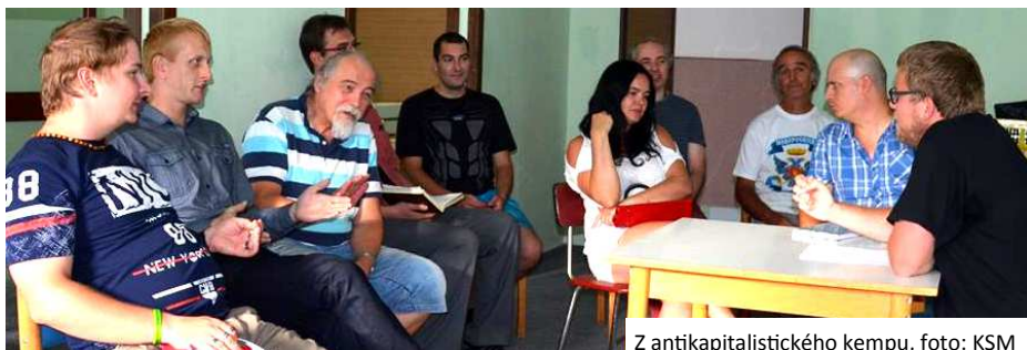
Z antikapitalistického kempu