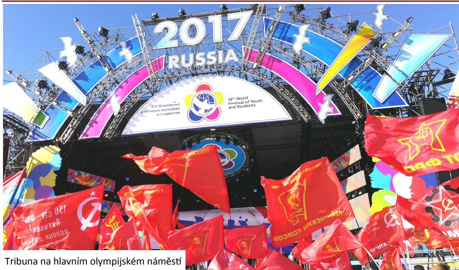
Tribuna na hlavním olympijském náměstí

vovaly výstavy fotografií věnované oběma. Spřátelili jsme se s některými delegáty a poznali lépe život, sny a ideály, které mají, ale hlavně jsme si odnesli to, co je na festivalu tím nejdůležitějším. Poznali jsme komsomolce mnoha zemí, seznámili se s jejich činností, navázali některé kontakty, získali cenné informace, ke kterým bychom se těžko jinak dostali a také jsme získali pocit sounáležitosti, že v úsilí o sociální spravedlnost nejsme sami.