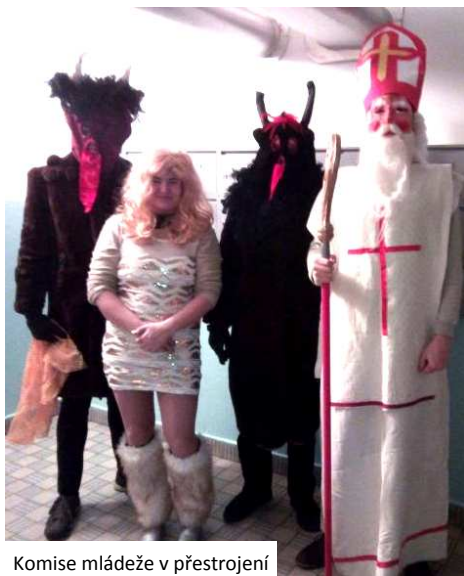
Komise mládeže v přestrojení

I v roce 2017 obcházel Českými Budějovici Mikuláš s pomocníky, mladými jihočeskými komunisty. Navštívil několik předem domluvených rodin a předal bohatou nadílku mnoha hodným dětem. Vše zdarma včetně nadílky. Zájem byl i tentokrát značný. Vždyť děti je jak smetí a jsou čím dál tím zlobivější.