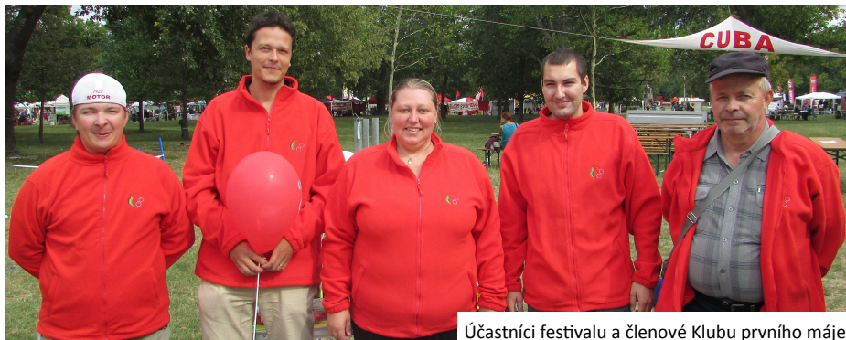
Účastníci festivalu a členové Klubu prvního máje

Také v roce 2017 přivítala Vídeň účastníky levicového festivalu na tradiční místo parku Jesuitenwiese. Program obou víkendových dní (2.-3.9.) byl pro dchnut koncerty a nejrůznějšími přednáškami na témata současnosti, ať už to jsou mír ve světě, boj za sociální spravedlnost, nebo třeba i vysoké náklady na bydlení. Naše delegace se zaměřila na propagování činnosti komunistů u nás a snažili jsme se podle našich jazykových možností navázat kontakty s ostatními organizacemi v Evropě, abychom si vyměnili zkušenosti a pohledy na různé problémy. Českou delegaci tvořili členové krajských komisí mládeže jihočeského, ústeckého a jihomoravského kraje a samozřejmě se účastnil i Klubu prvního máje. Během festivalových dnů se nám podařilo navázat spojení s rakouskou KPÖ a maďarskými mladými komunisty. Stejně jako loňský rok jsme uspořádali soutěže a hry pro nejmenší účastníky a bylo vidět, že se dětem zalíbily. Festival Volkstimmefest není jen