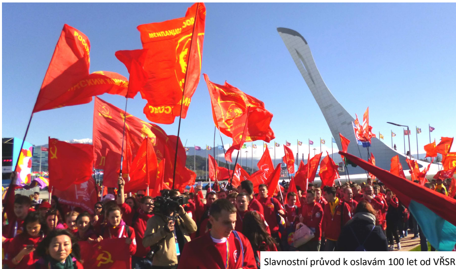
Slavnostní průvod k oslavám 100 let od VŘSR

samého počátku snažili o to, aby se festival stal naprosto apolitickým a tak jsme měli pocit, že se nacházíme na velikém ruském veletrhu. Ztráta politického ducha je ale úplně v rozporu se smyslem festivalů předchozích. Vždyť už první celosvětové setkání mládeže a studentstva v Praze roku 1947 bylo politické. Krátce po válce chtěla mládež oslavit mír, solidaritu, přátelství mezi národy a dát se na cestu jinou, cestou socialismu a sociálního pokroku.