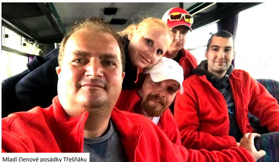
Mladí členové posádky Třešňáku