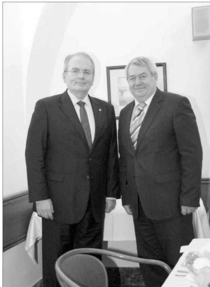
Předsedu komunistické Dělnické strany Maďarska Gyulu Thurmera přijal na půdě parlamentu Vojtěch Filip , předseda ÚV KSČM a místopředseda Sněmovny. Při večeri společně probrali současnou situaci nejen v České republice a Maďarské republice, ale i v Evropě a ve světě.

Pokud změnu zákonodárci neprosadí do konce roku, platy jim a dalším činitelům automaticky po 1. lednu vzrostou. Piráti a SPD proto chtějí novelu projednat co nejdříve. Poslanecké úpravy podali v úterý při druhém čtení návrhu zákona. Výbory návrhy Pirátů a SPD nepodpořily. Doporučily plénu přijmout vládní předlohu beze změn. Michálek obhajoval svůj požadavek argumentem, že když vláda zvýší platy učitelům a státním zaměstnancům, zvyšuje tím i platy politiků. Platy ústavních činitelů se mají podle návrhu vlády od příštího roku sice zvýšit, ale pouze v návaznosti na růst průměrné hrubé mzdy v nepodnikatelské sféře. Nezvyší se koeficient, kterým se tato mzda násobí. (ku)