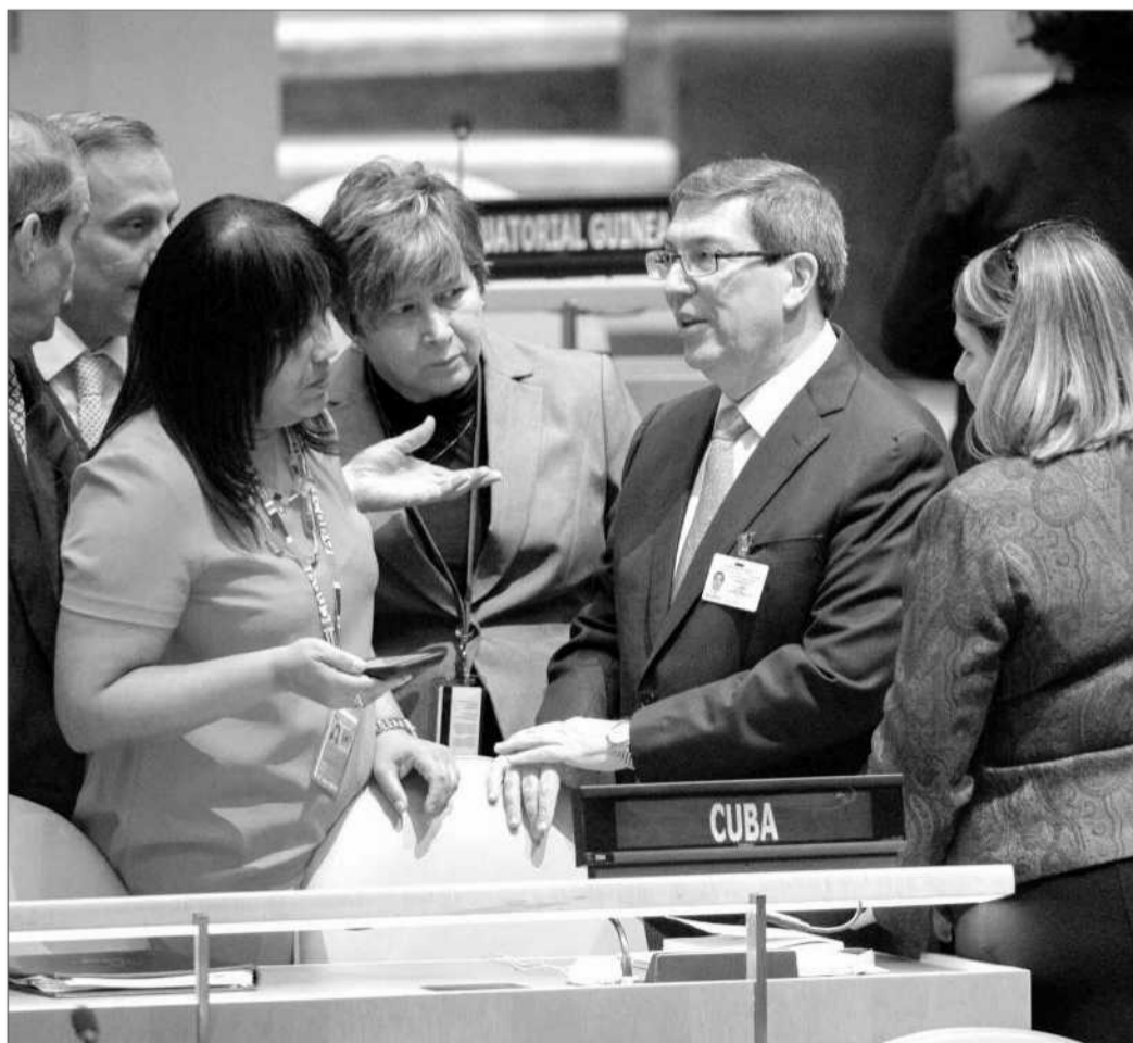
Kubánský ministr zahraničí Bruno Rodríguez Parrilla (druhý zprava) v debatě s diplomaty různých států, kteří mu před hlasováním přišli vyjádřit solidaritu.

Bouře si v Itálii od pondělka vyžádaly nejméně 17 obětí. Mezi nejpostiženější oblasti patří alpské regiony, jako je severoitalská provincie Belluno, kde jsou mnozí lidé už několik dní bez elektriny a některé obce jsou kvůli sesuvům půdy odříznuté od světa. (čtk)