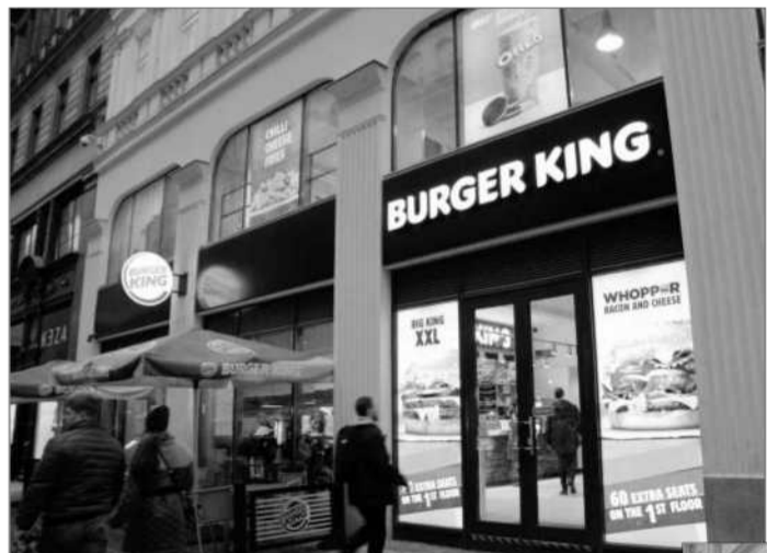
Dům číslo 767/12 kde dnes sídlí nadnárodní řetězec Burger King

Začátek známé lidové písně (kterou však už povětšinou asi bohužel ani neznáme) může připomínat reálnou situaci o podstatě článku, který vyšel před týdnem pod titulkem »Vlastenectví – v nás, či bez nás?«.