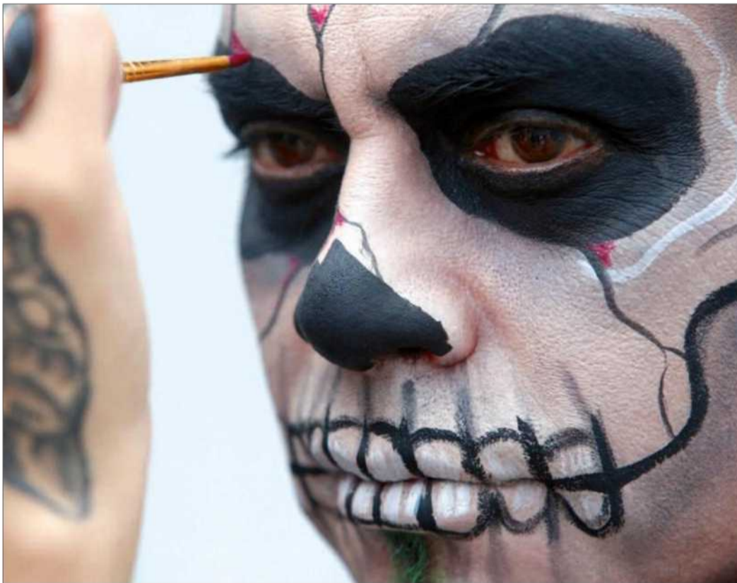
Typická tvář na oslavách Dne mrtvých

Pojídání kaštanů o svátku Castanyada vysvětlují některé prameny tím, že tyto energeticky vydatné plody jedlí zvoníci v kostelech, když tam trá-