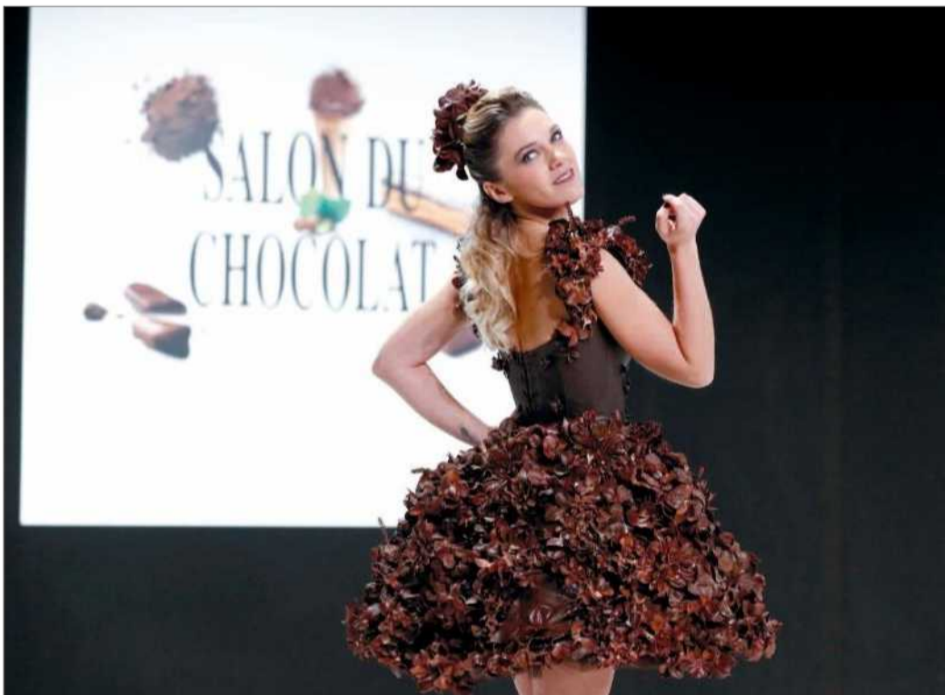
Modelka předvádí šaty ozdobené čokoládou na veletrhu čokolády ve francouzském hlavním městě Paříži. Její elegantní model ale zaručeně mezi trvale udržitelné nepatří.

Hongkongský ústav pro výzkum textilu a doplňků vyvinul vysoce vyspělou technologii, která umožňuje recyklovat látku. Nový závod, který byl otevřen zcela nedávno, sterilizuje a přetváří použitý textil v nová vlákna. Denně zpracuje tři tuny textilního odpadu. Recyklované vlákno má stejnou kvalitu jako nové, ale prodává se o 30 % levněji, vysvětluje ředitel ústavu Edwin Keh. K otevření tohoto závodu došlo v době, kdy Čína zavírá dveře před přivážením většiny pevného odpadu včetně textilu. Území, které se v roce 1997 vrátilo pod správu Pekingu, je tedy pod tlakem, aby si svůj odpad také samo zpracovávalo. »Čína nechce přivážet odpad, ale je velmi ráda, když získá vlákna a přízi, a to právě budeme dělat,« říká Edwin Keh. Doufá, že inspiruje další města. »Když jsme v tak přeplněném městě, jako je Hongkong, nalezli řešení, jak zpracovávat náš odpad, měla by toho být schopna i další města ve světě,« dodává. (ava, čtk)