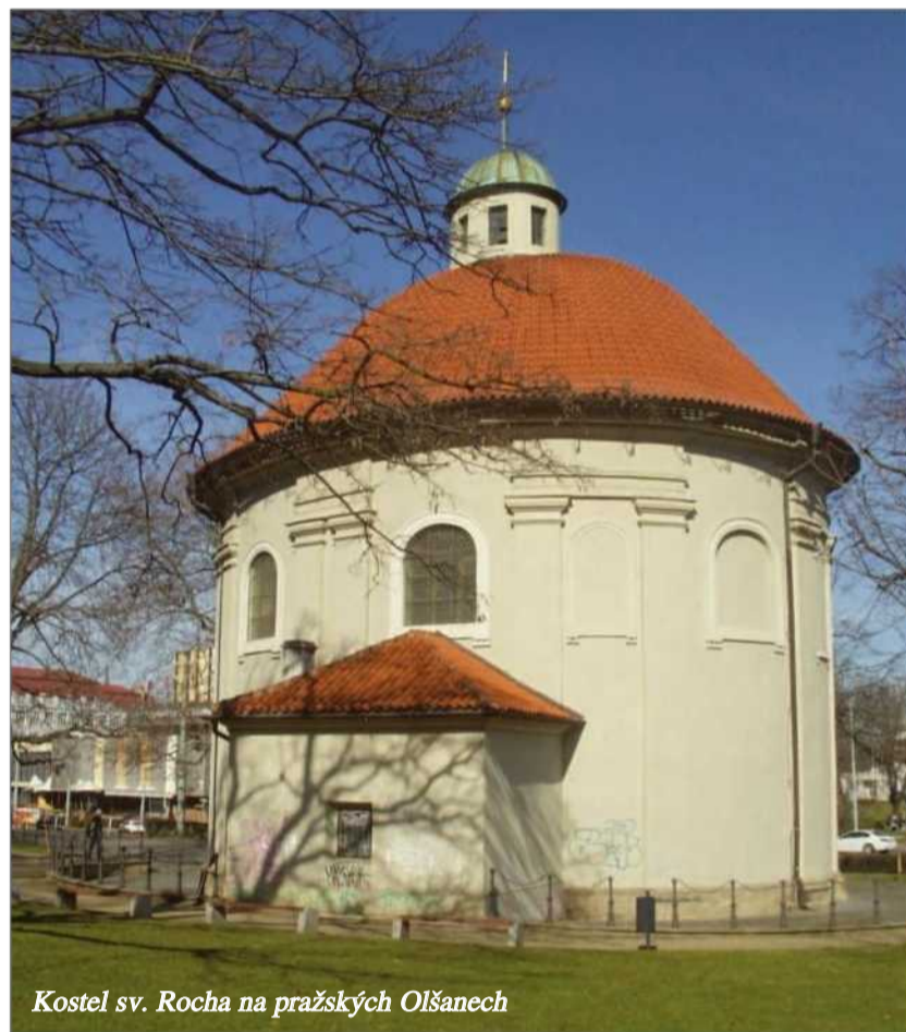
Kostel sv. Rocha na pražských Olšanech

Olšanské hřbitovy patří i k místům, kde si můžeme prohlédnout díla významných umělců. Například hrobku původně rakouského šlechtického rodu Pleschner von Eichstett navrhl český architekt a stavitel Josef Kranner (1801-1871). Informační tabule přímo u hrobky uvádí: »Mezi jeho pražské stavby patří pomník Františka I. na Smetanově nábřeží, Lannův palác v Hybernské ulici, schodiště z Karlova mostu na Kampu a především pak dostavba Katedrály sv. Víta na Pražském hradě.« Byl nejen prvním předsedou Jednoty pro dostavbu chrámu sv. Víta, ale i autorem novogotických úprav zámku Hluboká, Zleby a Hrádek u Nechanic. Místo svého odpočinku našel také na Olšanských