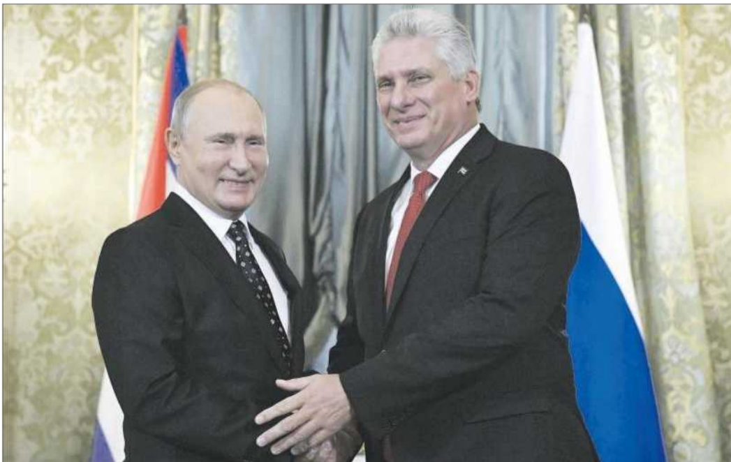
Jak uvedla ruská média, při schůzce Putina s Díazem-Canelem (vpravo) se také hovořilo o modernizaci kubánské armády. Rusko na ni poskytne půjčku ve výši 50 milionů dolarů.

»Sankční politika je to, proti čemu se my všichni musíme vymezovat, protože je v protikladu k mezinárodním normám a pravidlům, která musejí platit v našem multipolárním světě,« řekl Volodin podle agentury TASS. »Rozhodovat může jen OSN a my se musíme chovat v souladu s rozhodnutími, která přijaly všechny státy. Dnes jedna země poru-