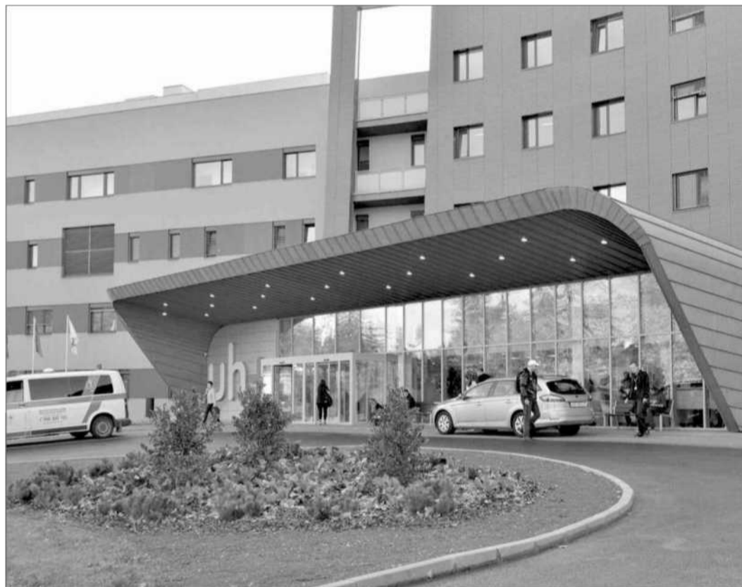
Uherskohradištská nemocnice slavnostně otevřela novou vstupní budovu. Lidé v ní najdou informační pult, sociální zařízení a samoobslužný bufet.

To vyznamenání pro Jaromíra Nohavicu je od lidí, od národa. Je to vyznamenání za upevňování přátelství. Přátelství mezi národy. Už jen ta věta zní krásně. Pro mne to je zpívaný svátek, takové zpívané jubileum . Monika HOŘENÍ