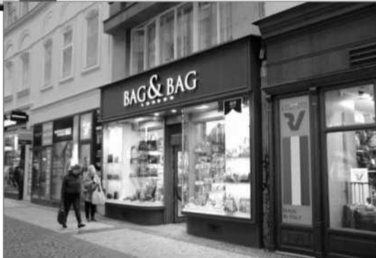
Dům číslo 764/8 s londýnským obchodním zastoupením Bag & Bag

Nejčastějším »mezinárodním jazykem« jsou v centru Prahy (ale i jinde)