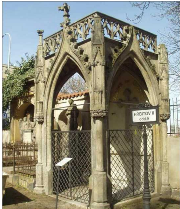
Hrobka od architekta Josefa Kranner

1784. Miloš Szabo v knize o IV. hřbitově na tomto pohřebišti ho charakterizuje takto: »Naráž byly zrušeny veškeré hřbitovy a pohřebiště uvnitř pražských městských hradeb (s výjimkou Vyšehradu) a to včetně hrobek v kostelích a klášterech.« Toto hygienické opatření znamenalo, že se Olšany staly hlavním pohřebištem pro celý pravý břeh Vltavy v Praze. K předchozím pozemkům označovaným jako I., II. a III. Olšanský hřbitov byl zakoupen další »o rozloze 5 jiter a 323 čtverečních sáhů«. Teď po těchto čtyřech částech vede naučná stezka, lépe řečeno u cestiček jsou rozmístěny informační tabule o osobnostech, které zde mají hroby. K některým ale zajímavé údaje chybějí, i když by je návštěvníci jistě přivítali. Hned u brány do druhé části je například památníček, kde většinou nechybějí květiny. Připomíná dvě dívky, kterým kočár přejel nohy. Stalo se to dávno, a tak je možné,