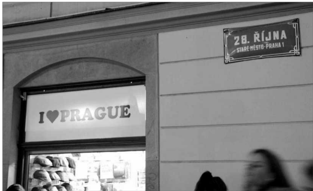
Dům číslo 761/2 kde se rovněž prodávají suvenýry