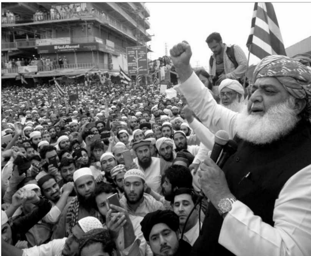
Maulana Fazalur Rehman, šéf islamistické strany Jamiar Ulema-e-islam, včera vyzýval k veřejné oběšeni Bibiové.

Radiální pákistánský islámský duchovní Háfiz Saíd, kterého Spojené státy a Indie viní z přípravy teroristických útoků v indické finanční metropoli Bombaji se 166 obětními z roku 2008, svolal na včerejšek masové protesty. Uskutečnit by se měly po tradičních pátečních modlit-