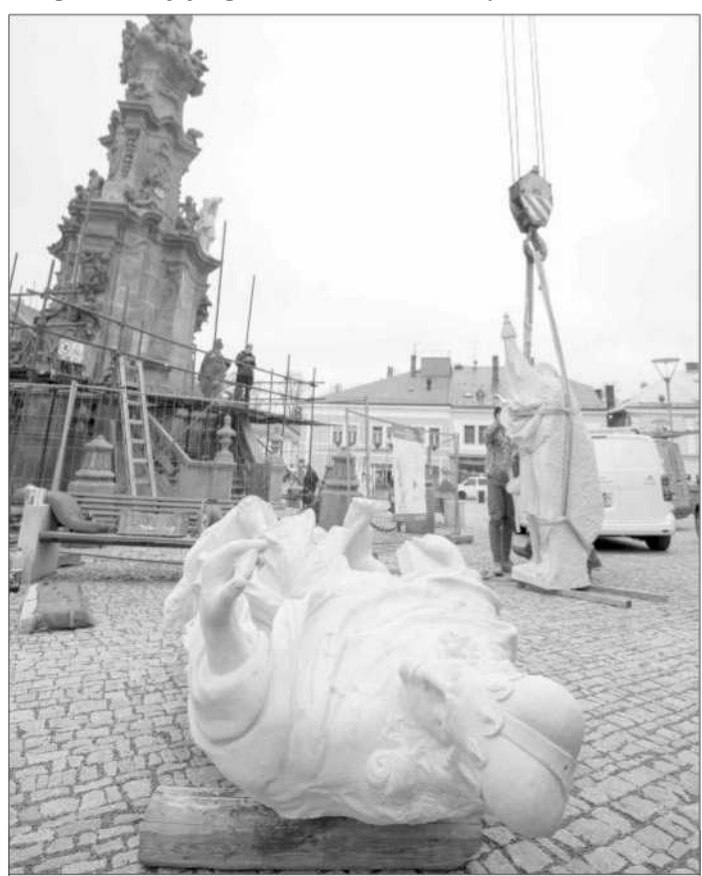
Opravy morového sloupu v Poličce na Svitavsku jsou po čtyřech letech restaurování téměř hotové. Včera byly osazeny dvě nové sochy.

Nejvyšší soud počátkem letošního roku odložil vykonatelnost verdiktu o vyklizení. Odklad ale platil jen do rozhodnutí o dovolání, které podle justiční databáze padlo 2. října. Nejvyšší soud, stejně jako nyní Ústavní soud, aktivistům nevyhověl. (ste)