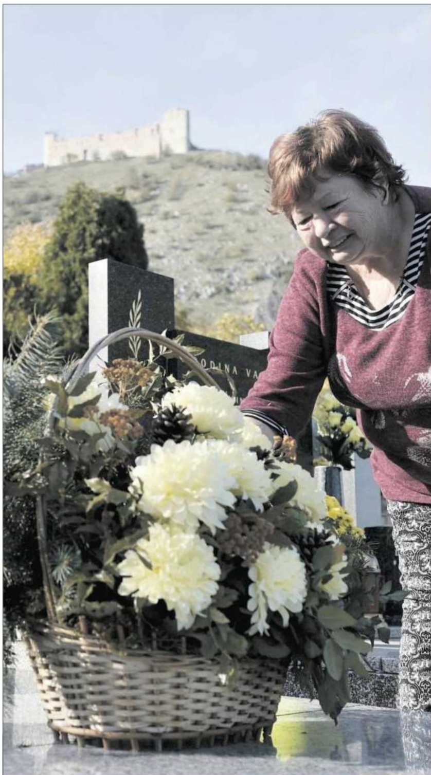
Lidé po celé zemi vyrazili včera na hřbitovy u příležitosti tradičního svátku Památky zesnulých, takzvaných Dušiček. Na snímku návštěvnice hřbitova v Pavlově na Břeclavsku.