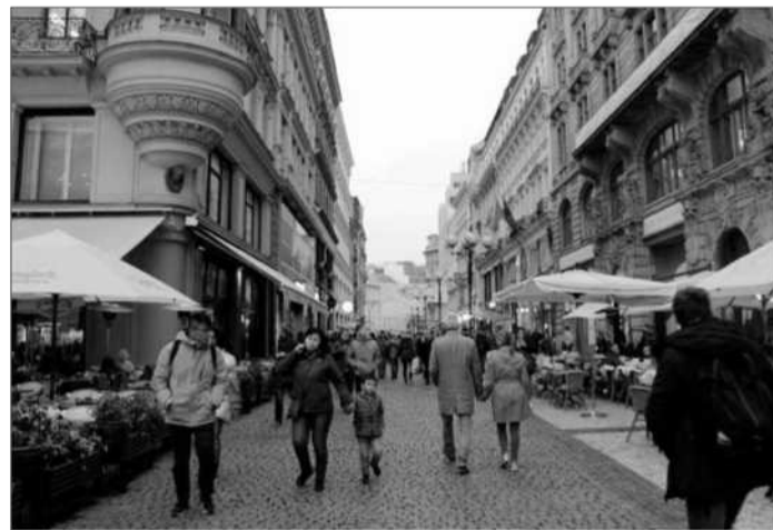
Průhled ulicí 28. října z Václavského náměstí

Tomáš HEJZLAR FOTO - Haló noviny/ Roman BLAŠKO a archiv