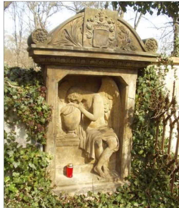
Náhrobek od Václava Prachnera