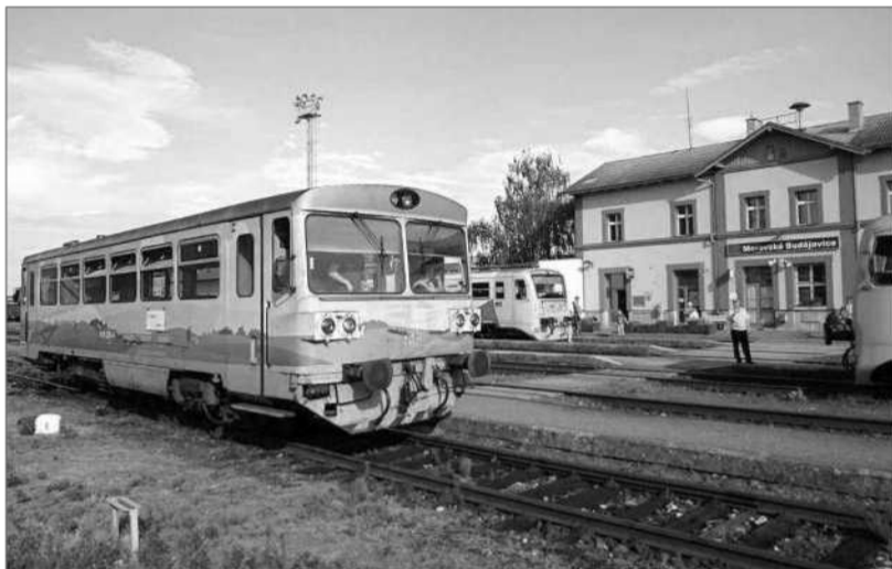
Znovu bude uvedena do provozu Jemnická dráha.

Nový jízdní řád podle SŽDC obsahuje 9509 pravidelných a 152 příležitostných spojů celkem 13 dopravců. Z pravidelných spojů je 704 dálkových a 8805 regionálních.