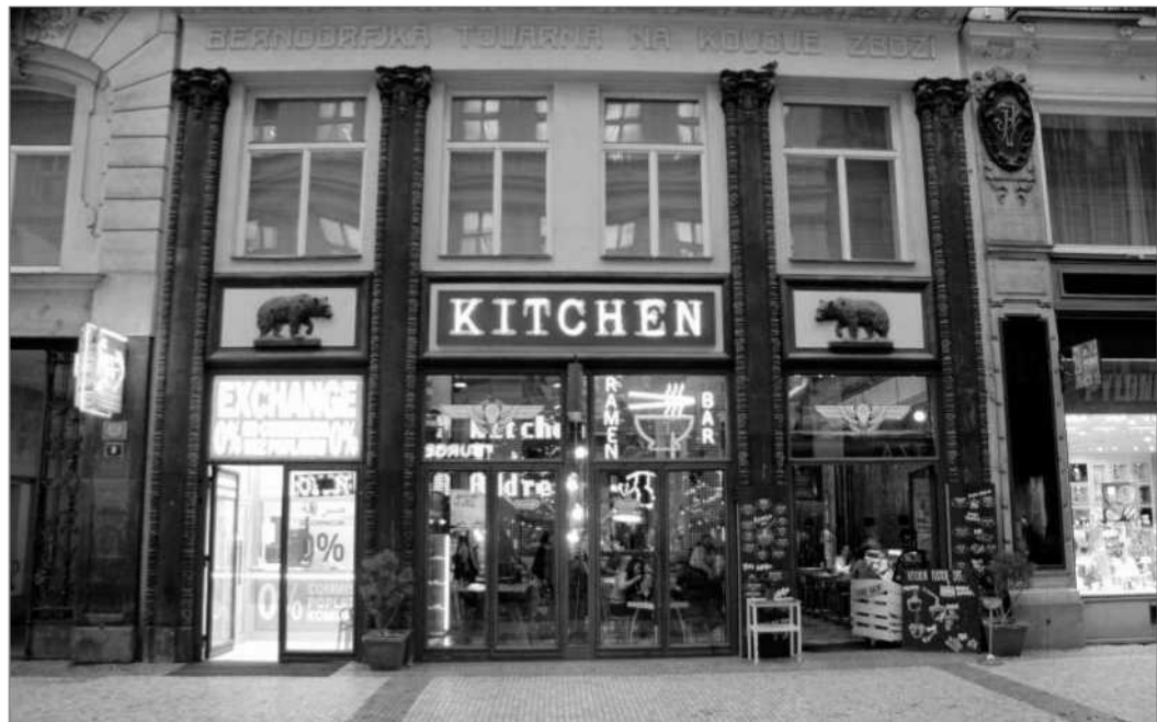
Dům číslo 375/9 s kde byla továrna na kovové zboží