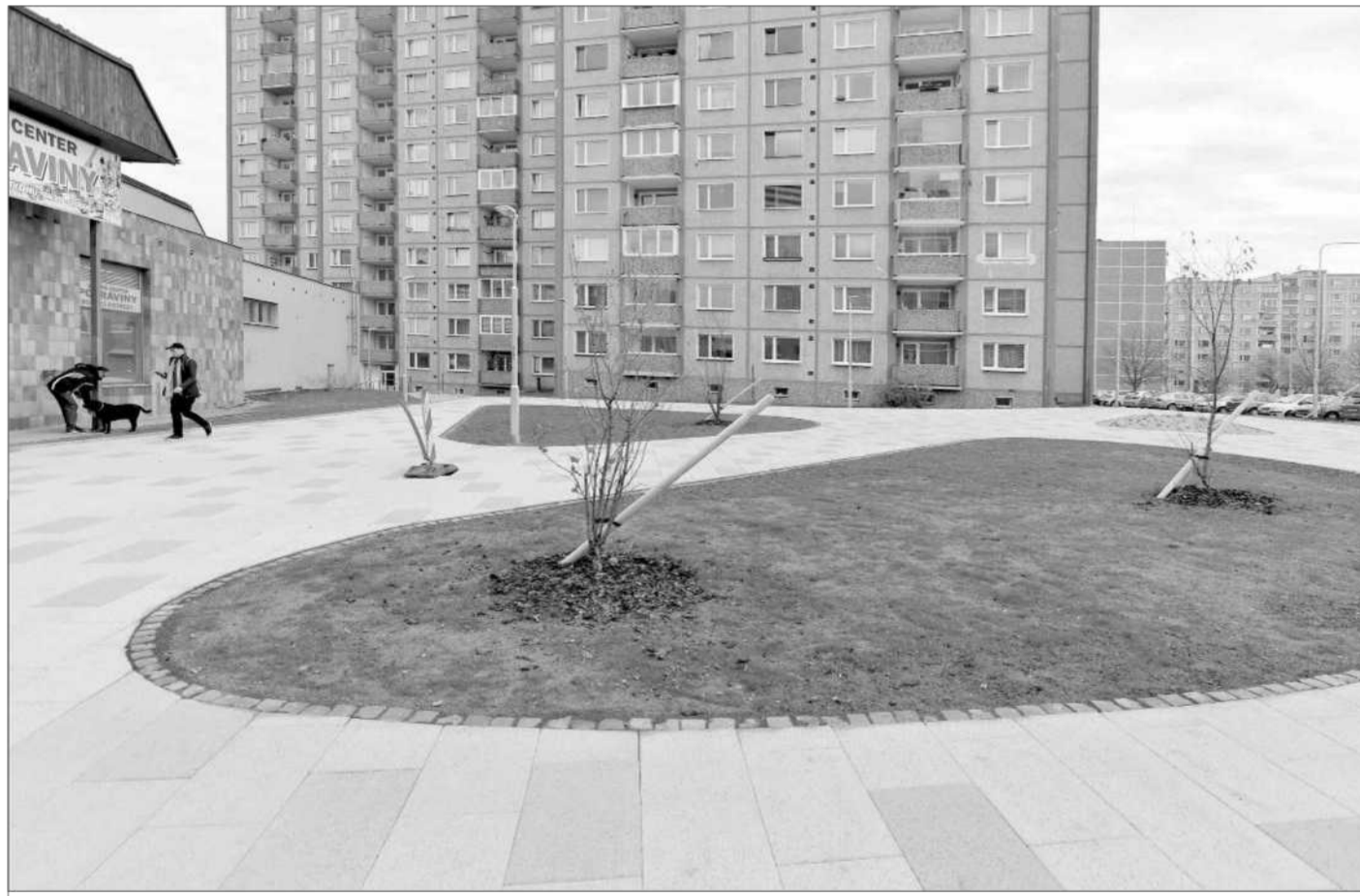
Na sídlišti Vítězná v Sokolově skončila rekonstrukce prostranství u obchodu mezi ulicemi Spartakiádní a Jiřího z Poděbrad.

Vojtěch FILIP , předseda ÚV KSČM a místopředseda Sněmovny, bude v neděli od 12.00 hostem pořadu Otázky Václava Moravce na České televizi. Diskutovat se bude například o koaliční spolupráci na komunální úrovni, důležitých ekonomických rozhodnutích na vládní úrovni či o stavu vyjednávání nového vedení Senátu.