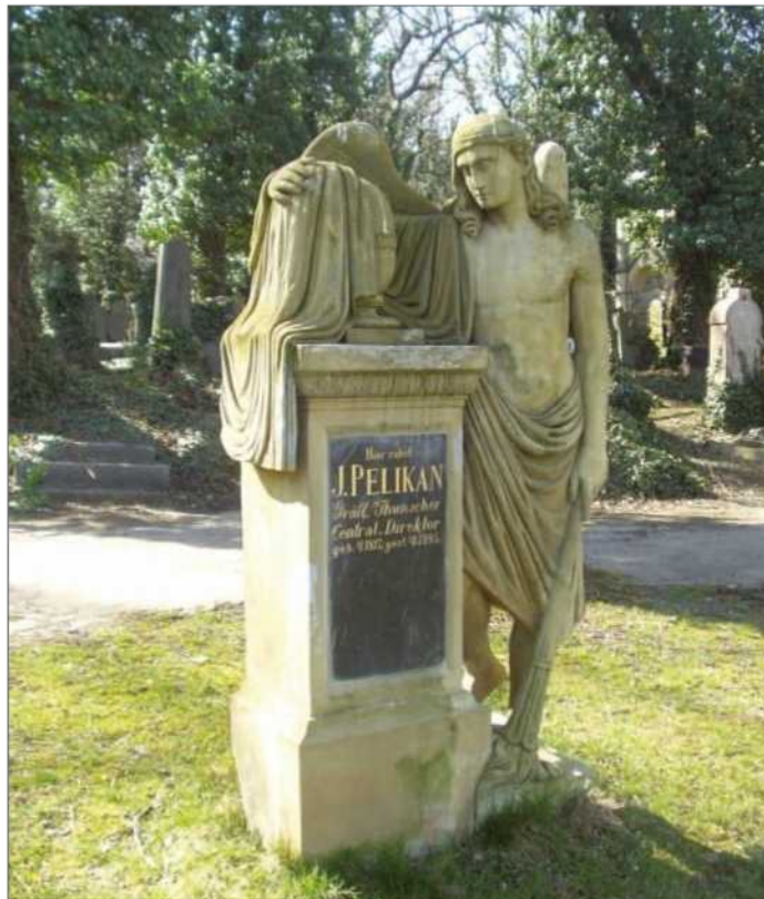
Plastika na hrobě Josefa Pelikana