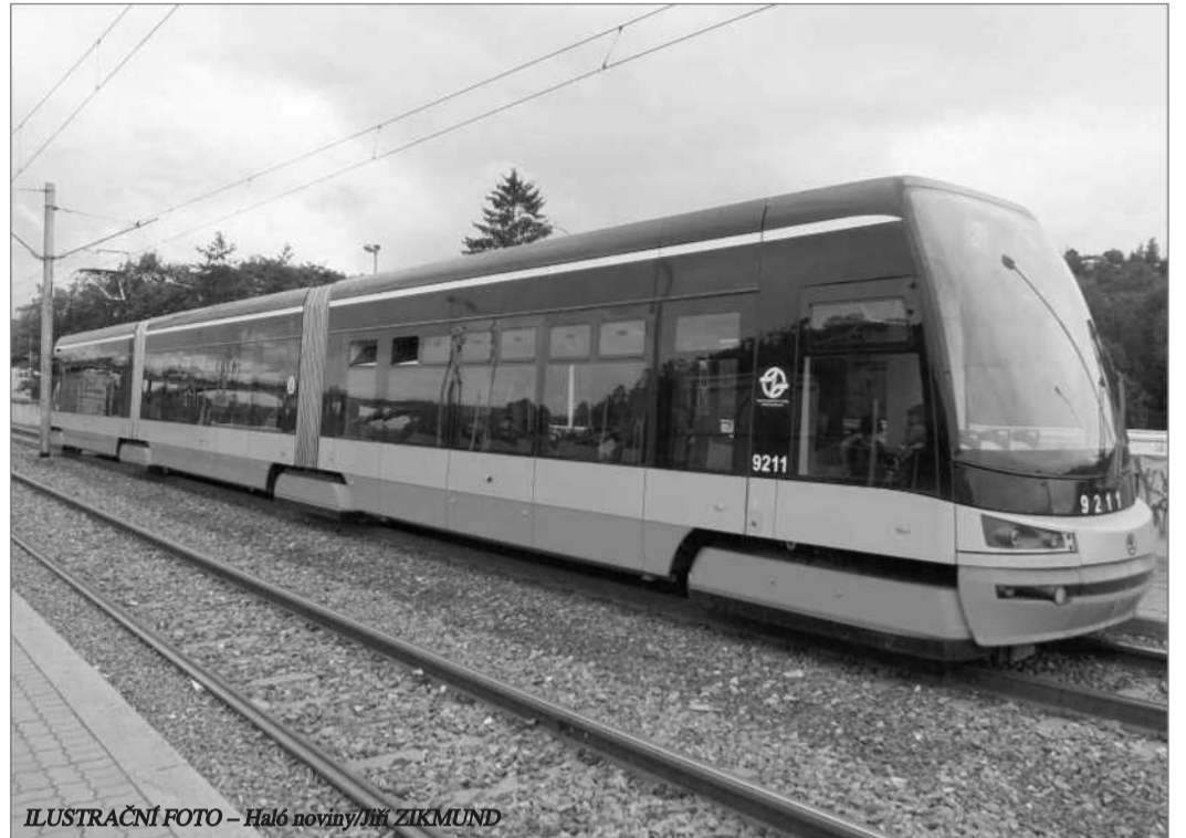
ILUSTRÁČNÍ FOTO – Haló noviny/JH ZIKMUND

S nedostatkem řidičů se potýkají i dopravci v dálkové autobusové dopravě, kde schází asi 5000 šoférů. Přes 15 000 profesionálních řidičů podle dopravců chybí v nákladní dopravě.